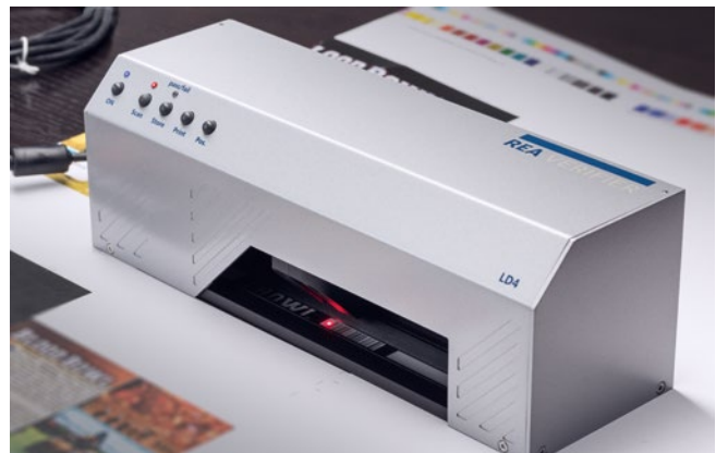
Messung von Druckbögen in der Fertigung