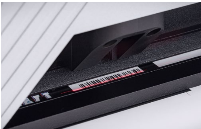
Eine Messung wird ausgeführt